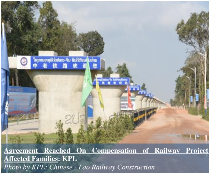
Agreement Reached On Compensation of Railway Project Affected Families: KPL Photo by KPL: Chinese - Lao Railway Construction